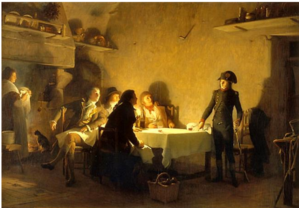
Le Souper de Beaucaire, le 28 juillet 1793 / Jean-Jules-Antoine Lecomte du Nouÿ, vers 1869.