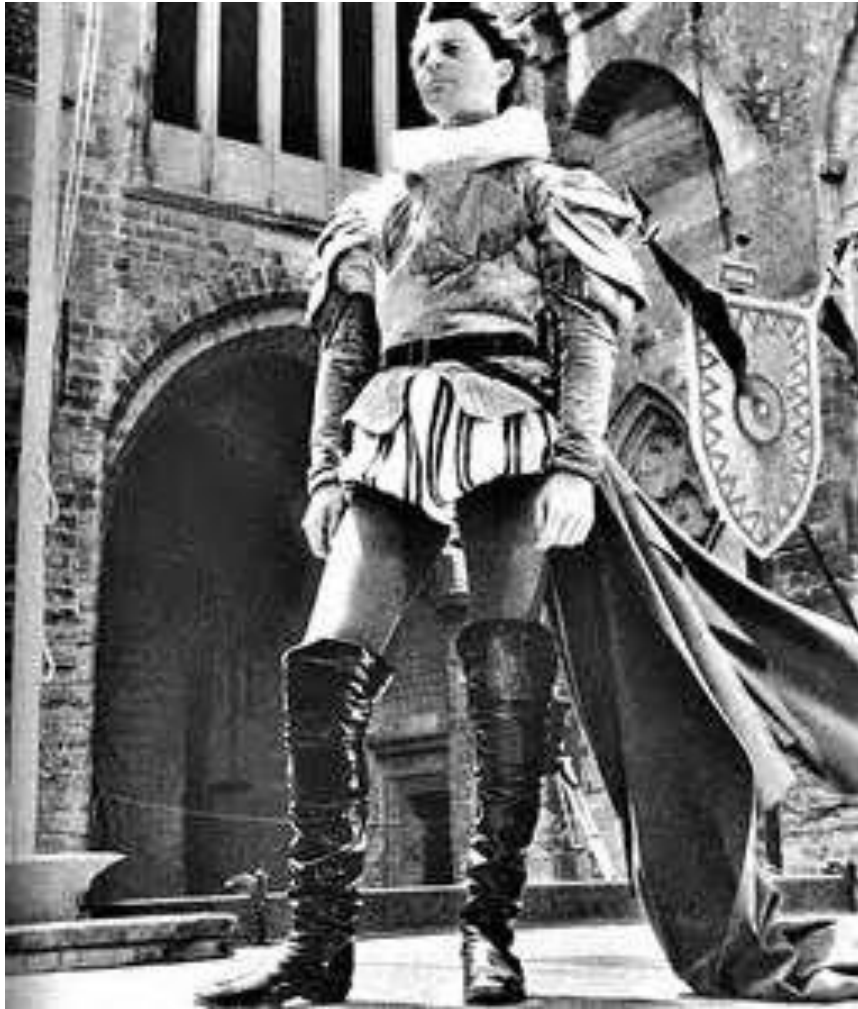
Gérard Philippe dans Le Cid , Festival d'Avignon, juillet 1951.